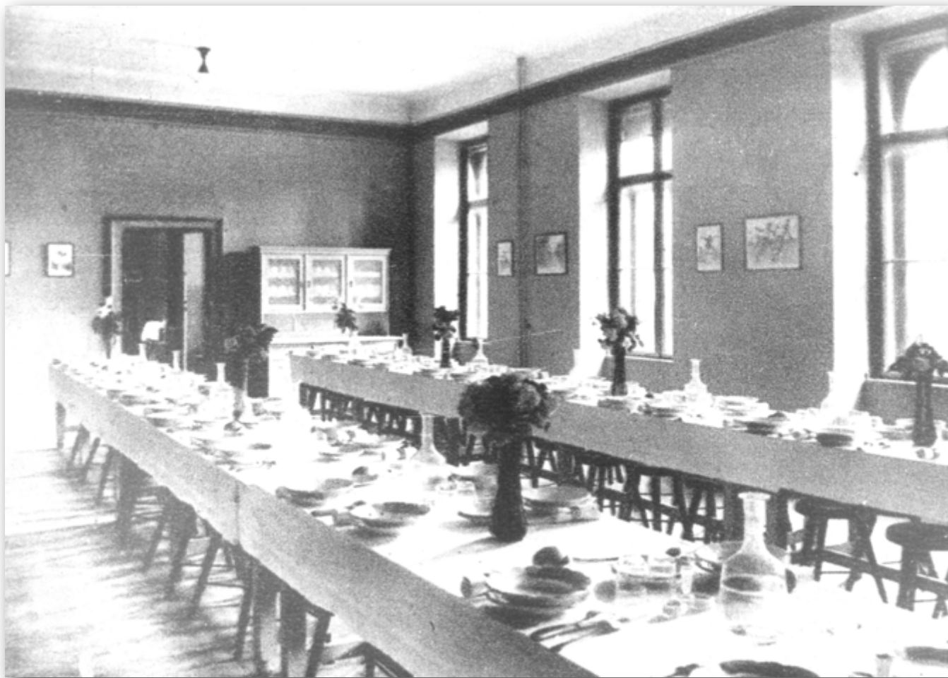
Balra: díszes étkezőhelység, szépen megterítve